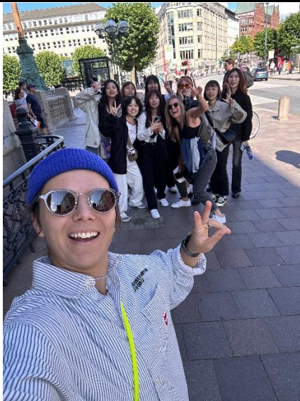
外國人說可以跟我們合照嗎