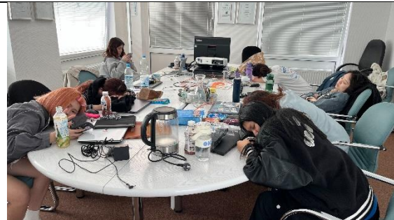
上班中午休息時間