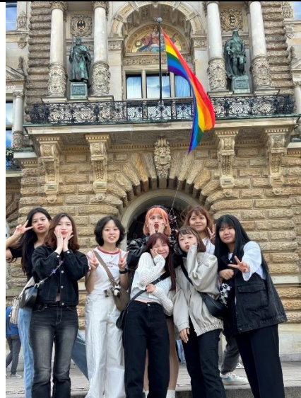
大家一起在市政廳外合照