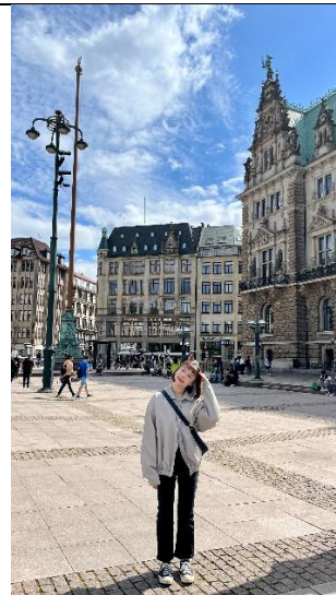
在漢堡市政廳拍照