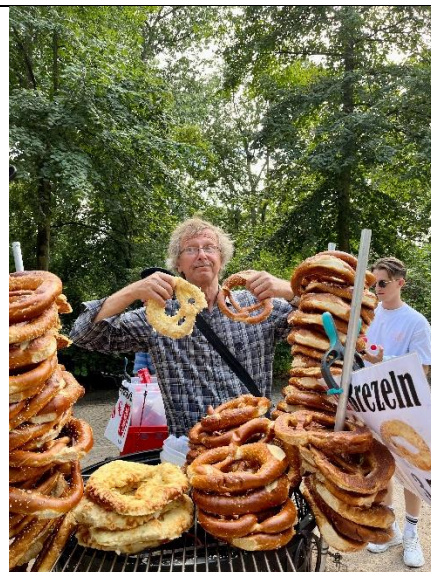
來德國必吃的麵包