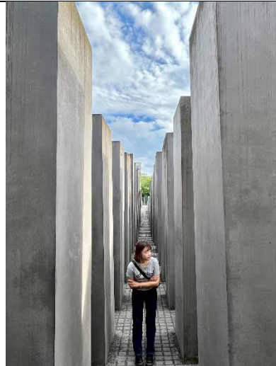
歐洲被害猶太人紀念碑