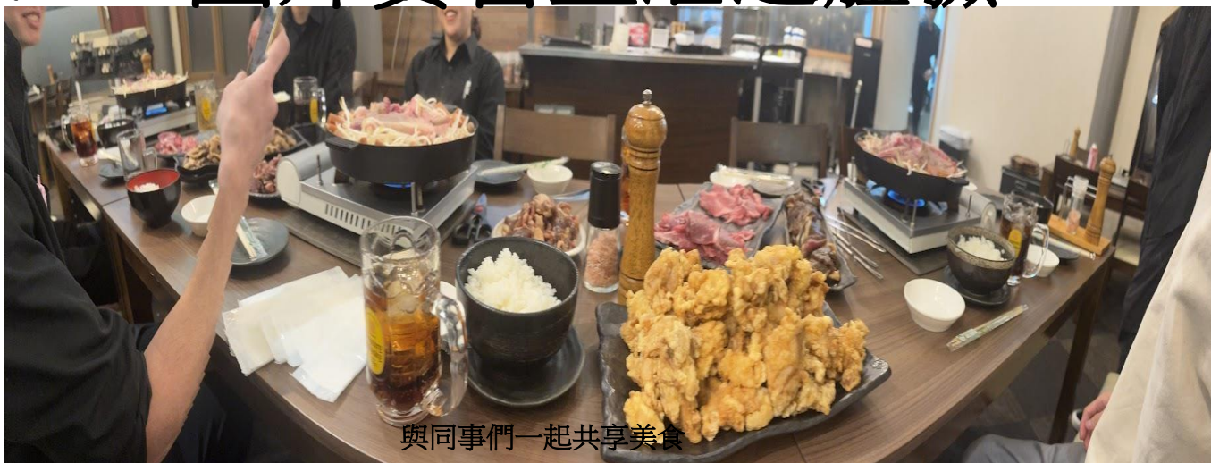
與同事們一起共享美食