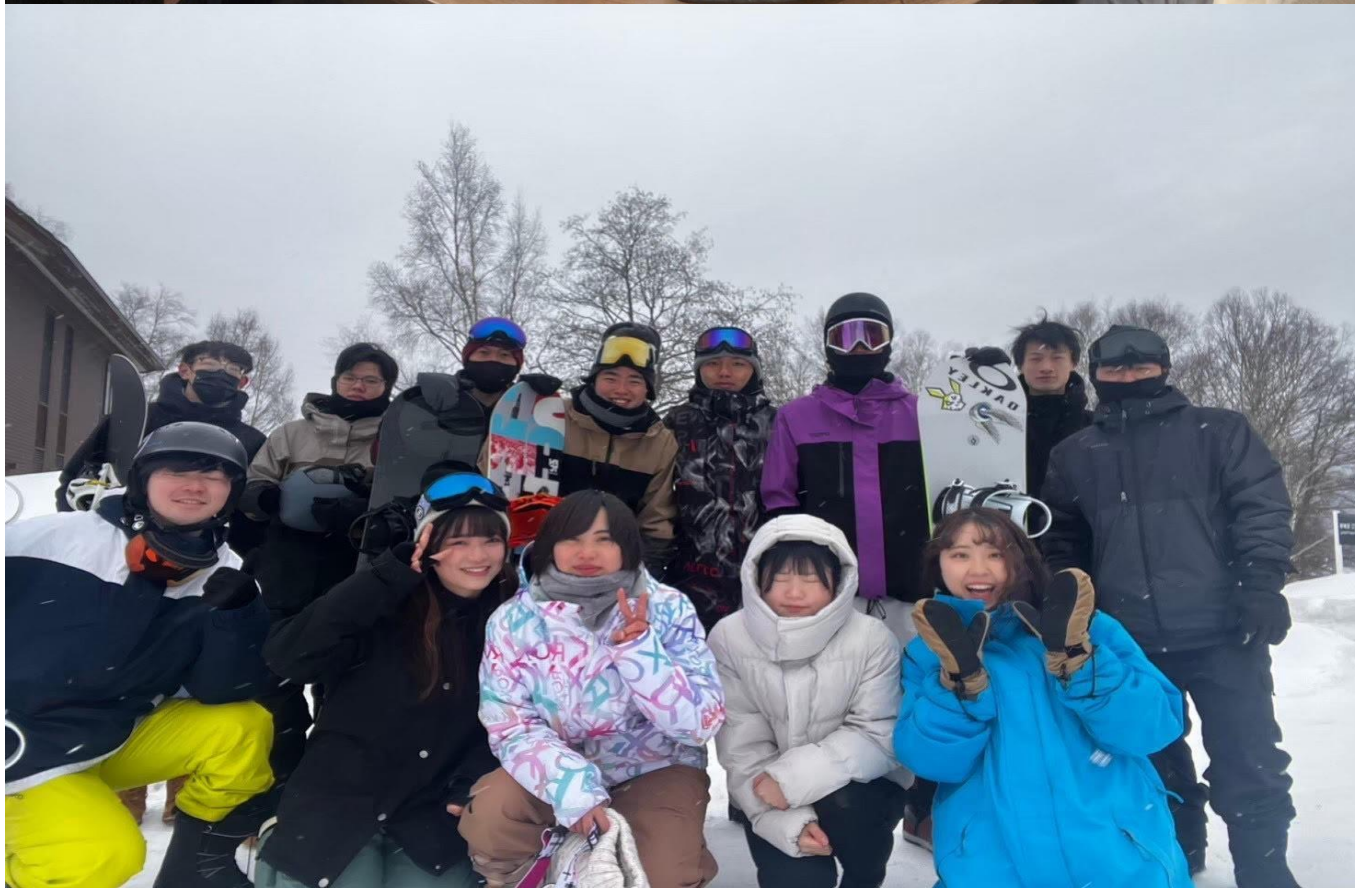
與同事們一起滑雪